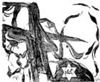
Judentum, 2002 Lithografie: Tusche und Kreide