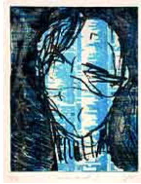
Unbekannt I, 1998 Zweifarbiges Tiefdruck, resistente Tusche, Kopierverfahren