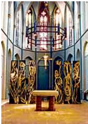
Die Gequälten, 1991 6 Druckstöcke

Auch die grafischen Blätter aus der Werkgruppe der Köpfe beeindruckten durch ihren Facettenreichtum und die Einheit von überzeugender, eindringlicher Bildsprache und handwerklicher Professionalität, Kriterien, das gesamte Œuvre prägen. Überall begegnet man Dohmens analytischer, sezierender Zeichenkraft, mit der er Kopf und Körper des Menschen skelettartig freilegt. Physiognomie und individuelle Merkmale lösen sich dabei weitestgehend auf. Die verbleibenden Rudimente speichern das zutiefst Menschliche, frei von beherrschender Absicht. Sie spiegeln das Interesse des Künstlers an seiner Lebensumwelt, am Mitmenschen, aber auch seine ganz persönlichen Erfahrungen und Empfindungen.