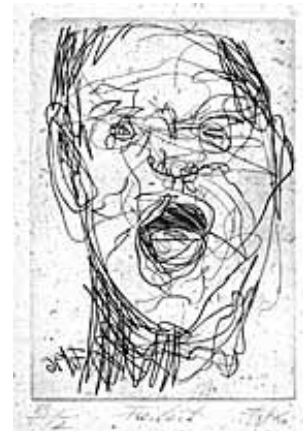
Freiheit, 1997 Kupferstich auf handgeschöpftem Papier aus zerkleinerten DM- Banknoten