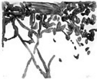
Christentum (Bergpredigt), 2002 Lithografie: Tusche und Kreide