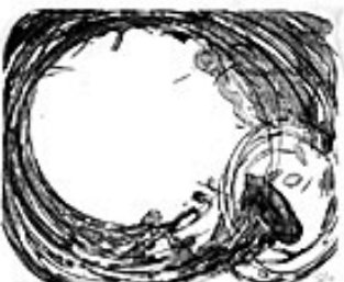
Buddhismus, 2002 Lithografie: Tusche und Kreide

Ausgehend von den grafischen Techniken – einem der wichtigen Themenfelder im Aufgabenspektrum des Buch- und Schriftmuseums – widmet sich die Ausstellung dem Œvre eines Künstlers, der seit Jahrzehnten innovativ auf diesem Gebiet tätig ist.