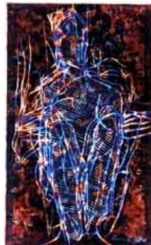
Große Kauernde, 1996 Holzschnitt untermalt, Unikat