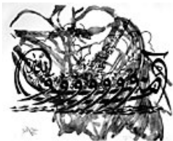
Islam, 2002 Lithografie: Tusche