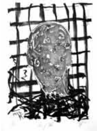
Vor Gitter, 1999 Lithografie: Kreide und Tusche