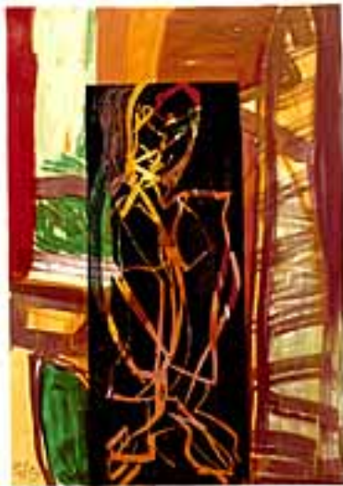
Kauernde II, 1993 Holzschnitt, untermalt, Unikat