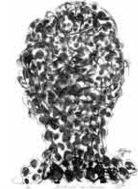
Nicht mehr zu erkennen, 2000 Lithografie: Umdruck, Tusche und Kreide