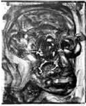
Schädel, 1983 Lithografie: Kreide, Tusche, laviert