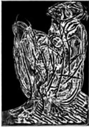
Kauernde, 1996 Resistente Tusche, Radierung, Aquatinta