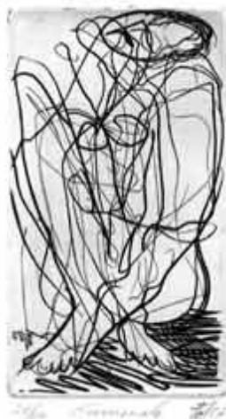
Kauernde, 1987 Kupferstich