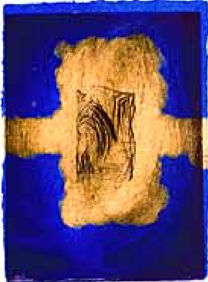
Aus: Zyklus Symphonie, 1988/91 Kupferstich, frei gewischt auf handgeschöpftem Flachpapier und gegossenem durchfärbtem Papierstoff

Auch die grafischen Blätter aus der Werkgruppe der Köpfe beeindruckten durch ihren Facettenreichtum und die Einheit von überzeugender, eindringlicher Bildsprache und handwerklicher Professionalität, Kriterien, das gesamte Œuvre prägen. Überall begegnet man Dohmens analytischer, sezierender Zeichenkraft, mit der er Kopf und Körper des Menschen skelettartig freilegt. Physiognomie und individuelle Merkmale lösen sich dabei weitestgehend auf. Die verbleibenden Rudimente speichern das zutiefst Menschliche, frei von beherrschender Absicht. Sie spiegeln das Interesse des Künstlers an seiner Lebensumwelt, am Mitmenschen, aber auch seine ganz persönlichen Erfahrungen und Empfindungen.