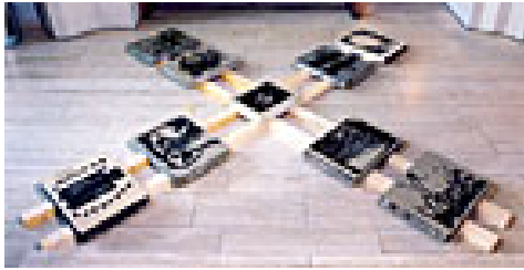
"Steine des Anstoßes", 2002 Installation