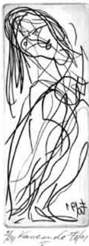
Kauernde V, 1991 Kupferstich

Die Ausstellung begegnet mit der Bildsprache von Walter Dohmen hochaktuellen Themen, die uns täglich über die Medien erreichen oder sogar direkt im Alltag tangieren: Gewalt, Aggression, Terror, Ausgrenzung, Schmerz, Trauer. Die Präsentation unternimmt den Versuch, über alle geografischen, kulturellen, sozialen, religiösen und politischen Grenzen und Vorbehalte hinweg, die verbindenden, Toleranz suchenden Aspekte des menschlichen Zusammenlebens ins Blickfeld zu rücken.